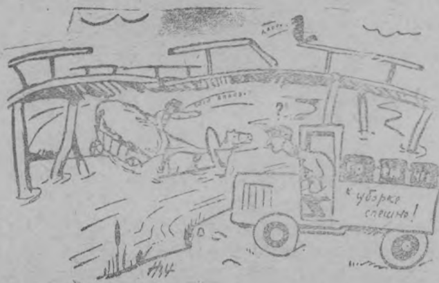
Чем через мост идти поищем лучше броду!