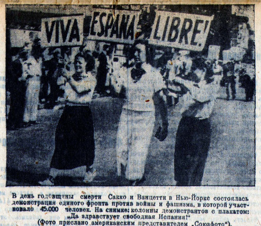
В день годовщины смерти Сакко и Ванцетти в Нью-Йорке состоялась демонстрация единого фронта против войны и фашизма, в которой участвовало 45.000 человек. На снимке: колонны демонстрантов с плакатом: «Да здравствует свободная Испания!»