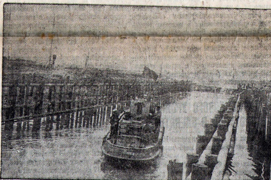
Сквозное движение по реке Маныч от Ростова до села Дивного

В 50 километрах от Ростова при впадении Маныча в Дон два года назад было начато строительство Манычского водного путя. 27 июня первый шлюз вступил в эксплуатацию. В текущем году будет закончен также второй шлюз у хутора Веселого и 6-километровая земляная плотина. К началу навигации будущего года откроется сквозное движение от Ростова до села Дивного протяженном в 380 километров.