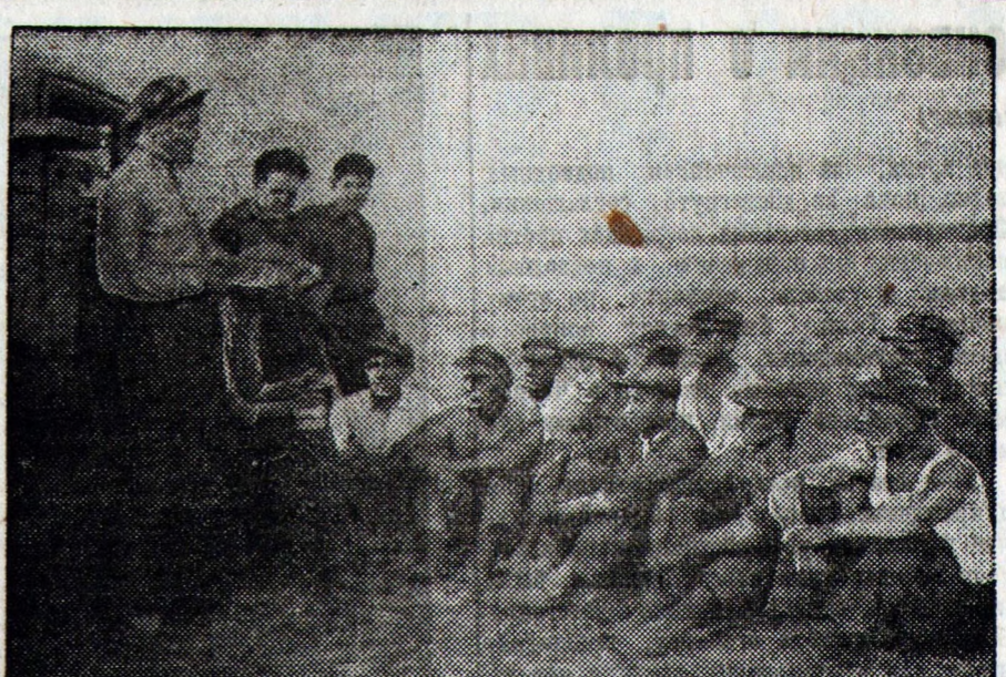
Давровская МТС (Харьковский район, Одесской области) организовала 10-ти часовую семинар для трактористов, работающих на уборочной.

Выработанный под руководством товарища Сталина проект Конституции СССР открывает новую эпоху советской демократии, особо значительную в отношении трудящихся бывших отсталых и бесправных народов нашей России — «торыми народами». Диктатура пролетариата дала бышим угнетенным национальностям возможность митовать все «предели» буржуазной демократии и использовать в целях своего возрождения все преимущества советской демократии.