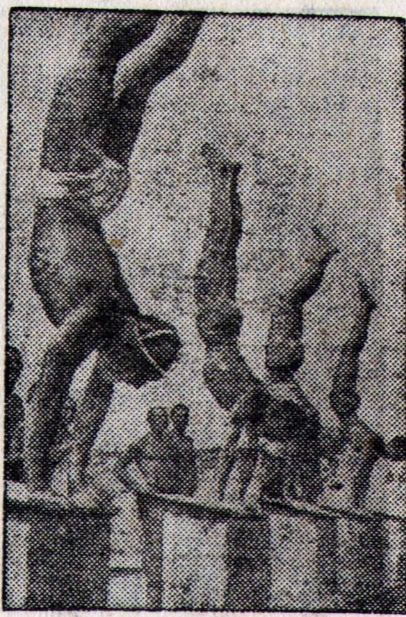
На водной станции в Энгельсе.

По поводу девятой статьи, устанавливающей принципиальную свободу прохода через проливы для военных судов в мир-