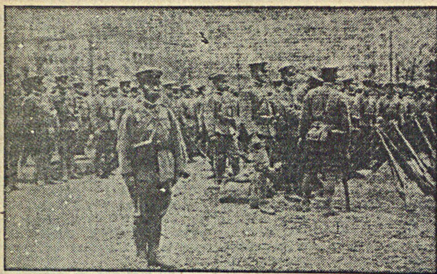
Новые подкрепления японских войск в Манчжоу-Го. На снимке: отряд студентов японской военной академии, отправляющийся из Токио в Манчжоу-Го.