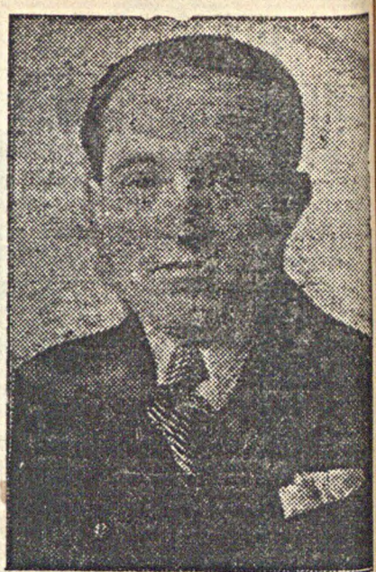
На снимке: участник третьего московского международного шахматного турнира гроссмейстер Сало Флор.