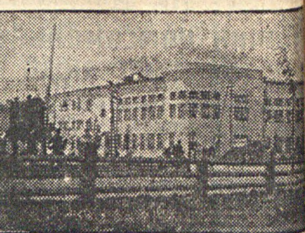
Здание Госбанка и Наркомфина в Энгельсе.

Ожидается прибытие нового звукового фильма «Родина».