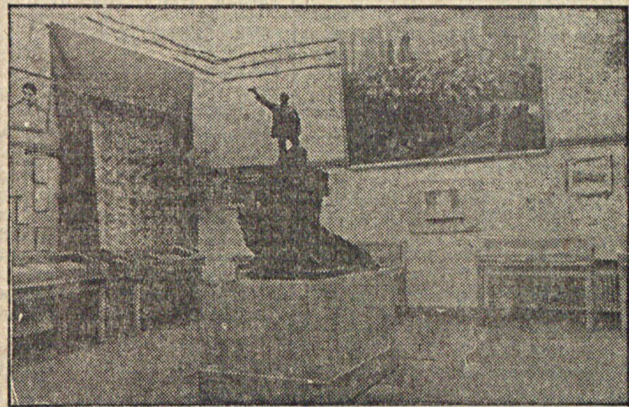
Музей В. И. Ленина в Москве. На снимке: зал VIII (март-июнь 1917 года). В центре скульптура худ. Манисера «Ленин на броневике».