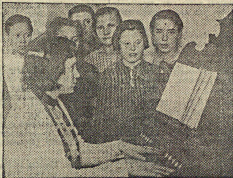
Шентальская средняя школа. Урок пения.

Цех небольшой. Работает там всегонавсего 53 человека. Однако, он производит весьма ценные изделия первой необходимости. В этом году, впервые мастерская начала осваивать производство перламутровых пуговиц из речных ракушек.