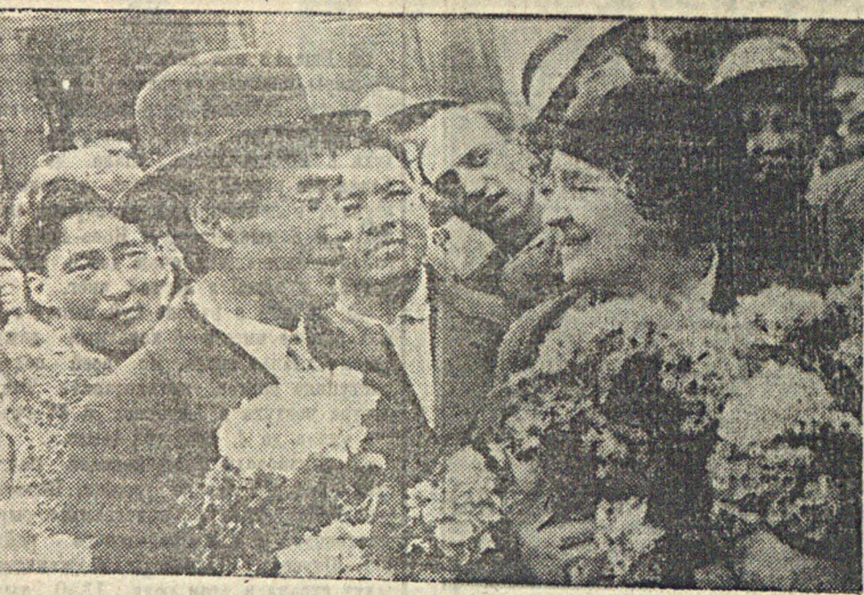
В Москву приехала гастроль казахский музыкальный театр, первое выступление которого состоится 18 мая — в день начала декады казахского искусства. Всего приехало 270 человек. Работники искусства Москвы устроили гостям торжественную встречу. На снимке: народная артистка республики Киппер-Чехова подносит цветы народному артисту Казахстана Шанину.

Но это только первые шаги в исправлении допущенных ошибок. Первые успехи нужно всемерно закреплять, доби-