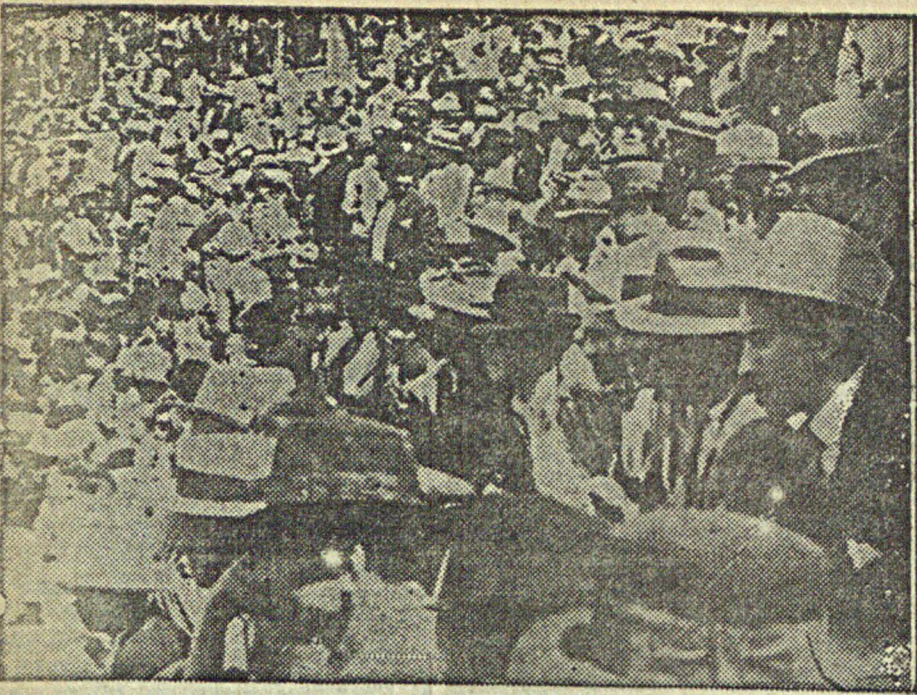
В Мексико-Сити (Мексика) состоялся массовый антифашистский митинг, организованный рабочей конфедерацией (профсоюзная организация). В помещении цирка собралось до 30.000 человек профсоюзных. На снимке: переполненные трибуны в цирке во время выступления представителей профсоюзов.