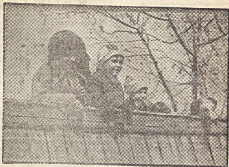
Весна вступила в свои права. Солнце греет все сильнее и сильнее.