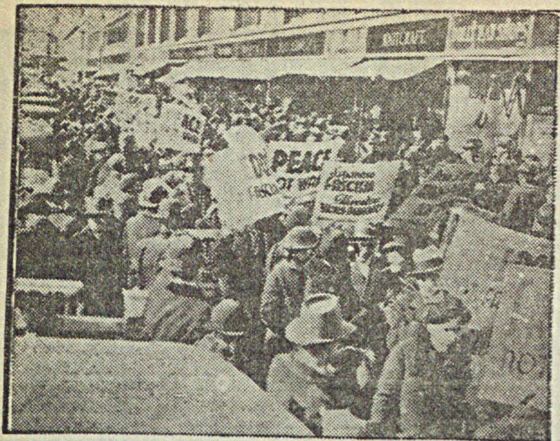
Антифашистская демонстрация в Нью-Йорке