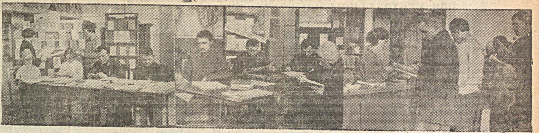
В Энгельсской Центральной библиотеке