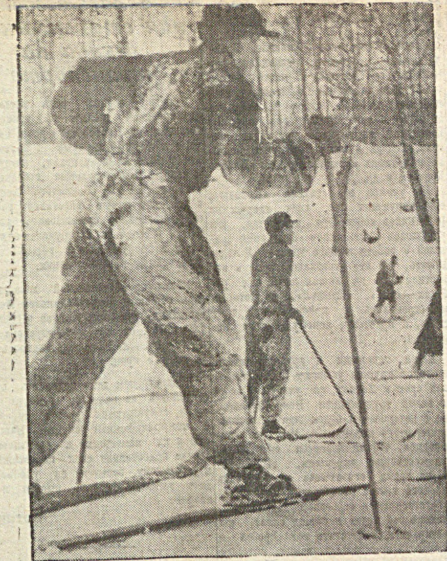
Ленинские горы — любимое место московских лыжников. На снимке: лыжники горно-лыжной школы спортивного общества «Локомотив».

С августа месяца 1935 года в Немреспублике открыты и функционируют три лечебно-воспитательных детдома Наркомздрава: в гор. Энгельсе — туберкулезный, в Марксштаде — трахоматозный, в Бальцере — наковный. Все наго дачи там дети имеют новые пальто, ботинки с галошами, 3—4 смены белья, питание хорошее, дети прибавляются в весе. Существует еще один детдом Нар-