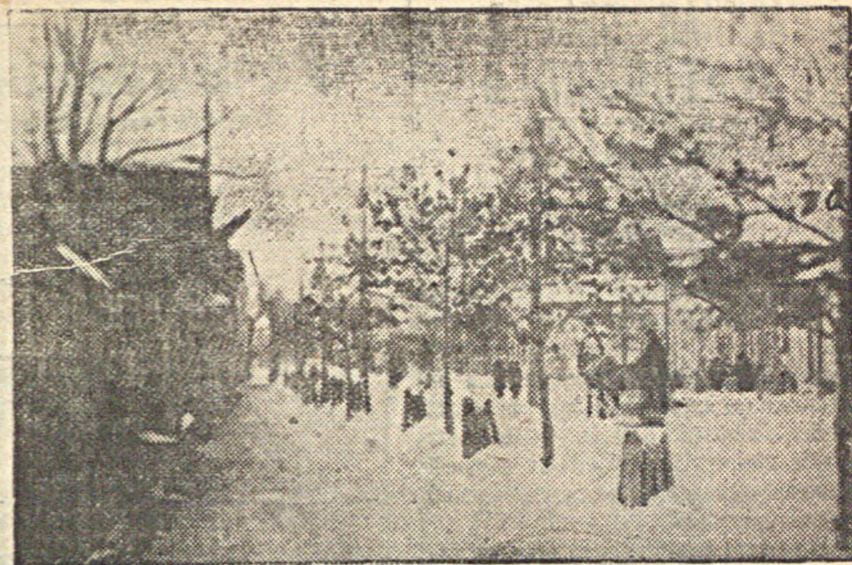
На снимке: посаженные в прошлом году елки на коммунистической улице между Центральной и ул. Ленина.

Обо всех случаях задержки выдачи оплаченных облигаций следует обращаться в управление ГТСК и ГК (оперативный сектор). Управление ГТСК и ГК АССРНП.