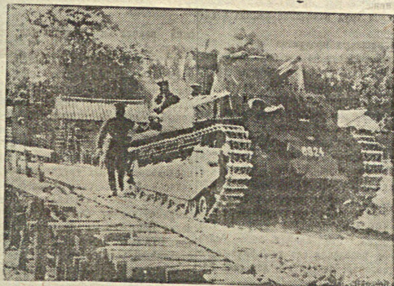
Маневры японской армии. На снимке: японские танки переходят во время маневров деревянный мост.

АДИС-АБЕБА, 22. В опубликованном здесь официальном сообщении говорится: „несмотря на то, наши армии сохраняют свое моральное состояние и свое единство.“