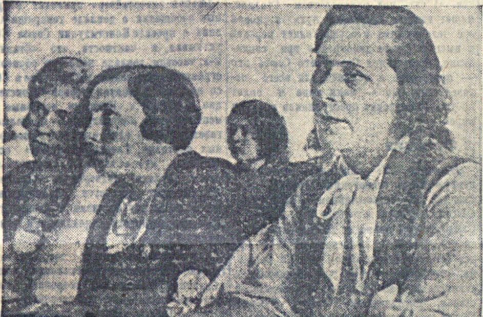
На организованных в Москве, по инициативе товарища Орджоникидзе, курсах по повышению квалификации общественности — жен хозяйственников и инженерно-технических работников тяжелой промышленности будет заниматься тысяча слушательниц.