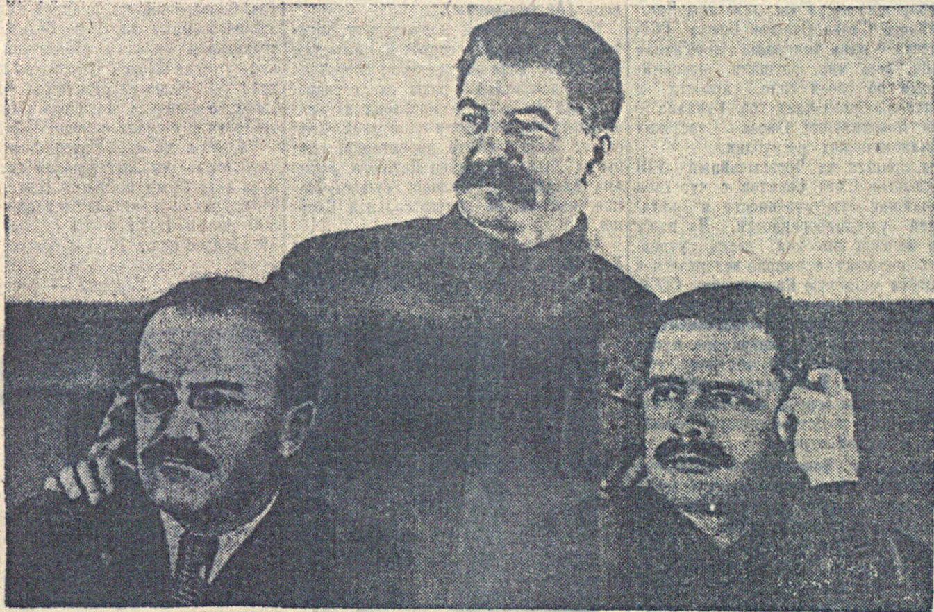
Товарищи Сталин, Молотов и Андреев в президиуме Всесоюзного совещания стхановцев промышленности и транспорта.

Пусть здравствует СТАЛИН! Пусть здравствует сталинская Конституция! (Перелова «Правды», перекл. по радио).