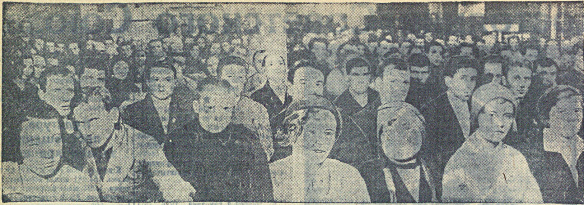
На снимке: студенты Немской Высшей коммунистической сельскохозяйственной школы слушают по радио доклад тов. Сталина.