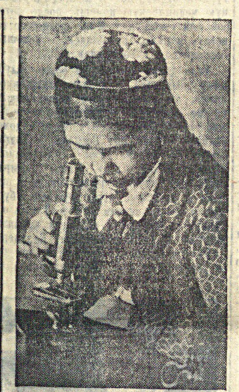
Граждане СССР имеют право на образование. (Проект Конституции Союза ССР, глава X статья 121).

На выставке представлены 29 картин, 7 рисунков и до 100 репродукций произведений Рембрандта.