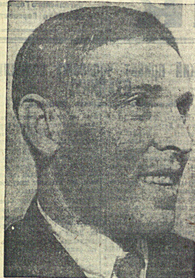
Алексей Григорьевич СТАХАНОВ