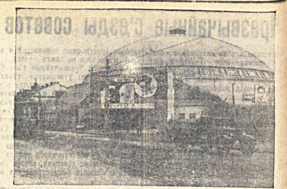
Саратов. Госцирк.

Всего со времени опубликования декрета по Союзу выдано 52708 тыс. рублей пособий.