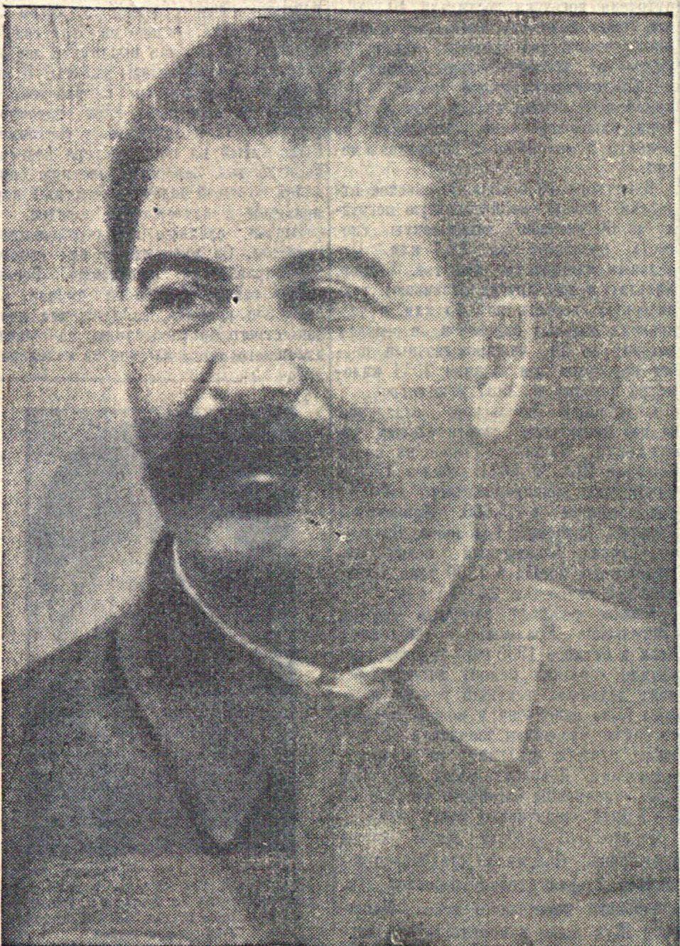
Значение стахановского движения состоит в том, что оно является таким движением, которое ломает старые технические нормы, как недостаточные, перекрывает в целом ряде случаев производительность труда передовых капиталистических стран и открывает, таким образом, практическую возможность дальнейшего укрепления социализма в нашей стране, возможность превращения нашей страны в наиболее зажиточную страну» (И. СТАЛИН. Из речи на первом Всесоюзном совещании стахановцев промышленности и транспорта).