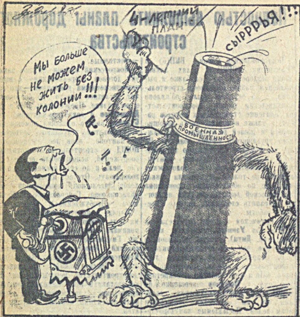
Фашистская шарманка. Третьей империи.