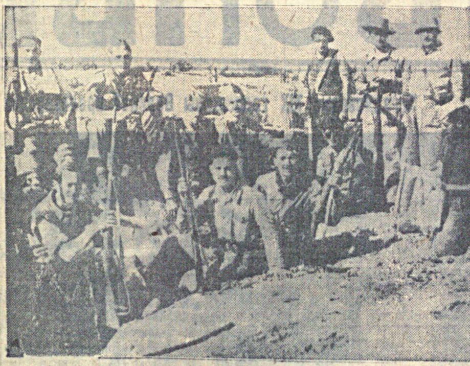
И события в Испании Ка снимке: отряд бойцов правительственной армии на привале (центральный фронт).

ние 8 трехмоторных самолетов «Юнкерс» в сопровождении 18 легких бомбардировщиков и истребителей. Им сброшено от 40 до 50 бомб. По предварительным данным убито 25 и ранено 200 человек.