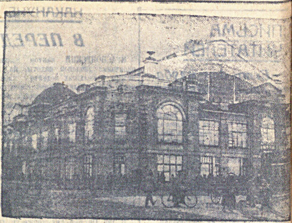
Гор. Саратов, Крытый рынок. Саратов.

Крупный недостаток в работе сельпо — плохая отчетность правления перед пащиками.