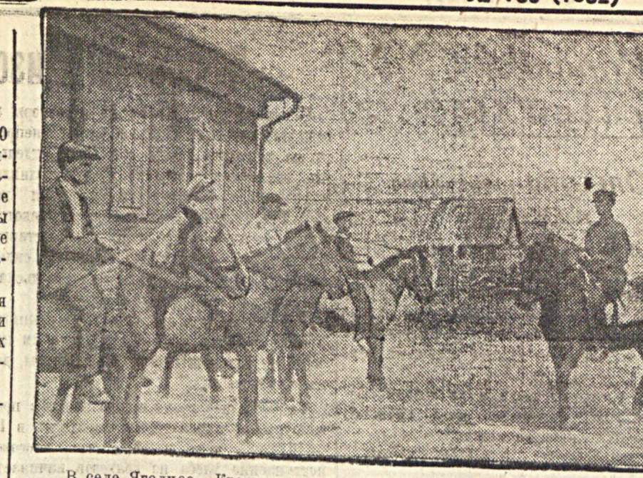
В селе Ягодное, Краснокутского кантона, организован кружок «Ворошилловских всадников». На снимке: занятия кружка.

Вот, что можно сказать о спектакле «Веселая вдова». Нам уже приходилось писать, что качество спектаклей музыcomedии значительно ниже возможностей коллектива. Объясняется это, во-первых, тем, что группа ставит очень много премьер, во-вторых, тем, что руководство театра явно неудовлетворительно борется за качество спектаклей, они зачастую получают серыми и сырыми. А ведь коллектив имеет возможность и артистические силы для того, чтобы создать яркий, запоминающийся, дипломатический спектакль.