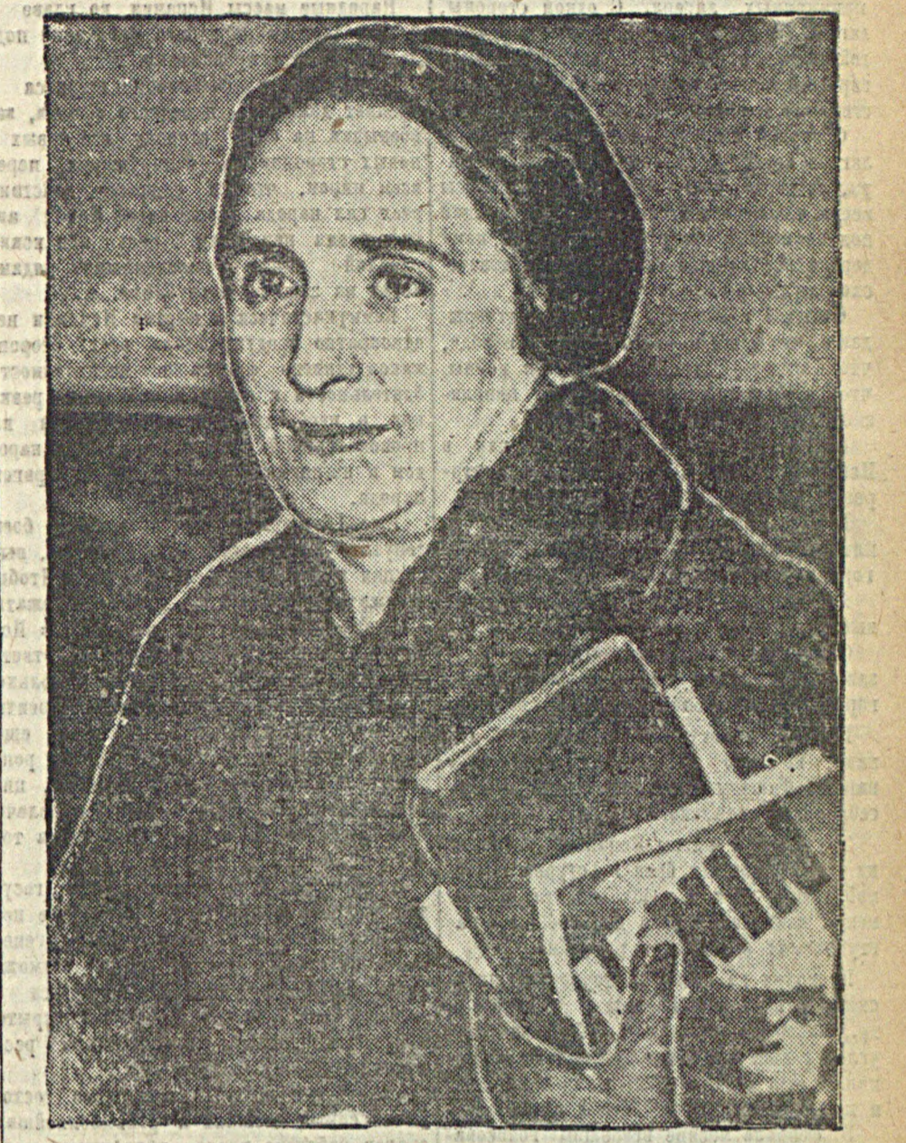
К военно-фашистскому мятежу в Испании. На снимке: одна из видных деятельниц испанской коммунистической партии Долорес Ибарури (Пасионария), которая сейчас активно участвует в боях против мятежников на одном из участков Северного фронта. Софотро.

Митинг заканчивается. 120.000 делегатов трудящихся столицы покидают площадь с сердцем, полным любви к испанским братьям, ненависти к их врагам, уверенности в сокрушительном разгроме фашистских мятежников и торжестве свободного испанского народа.