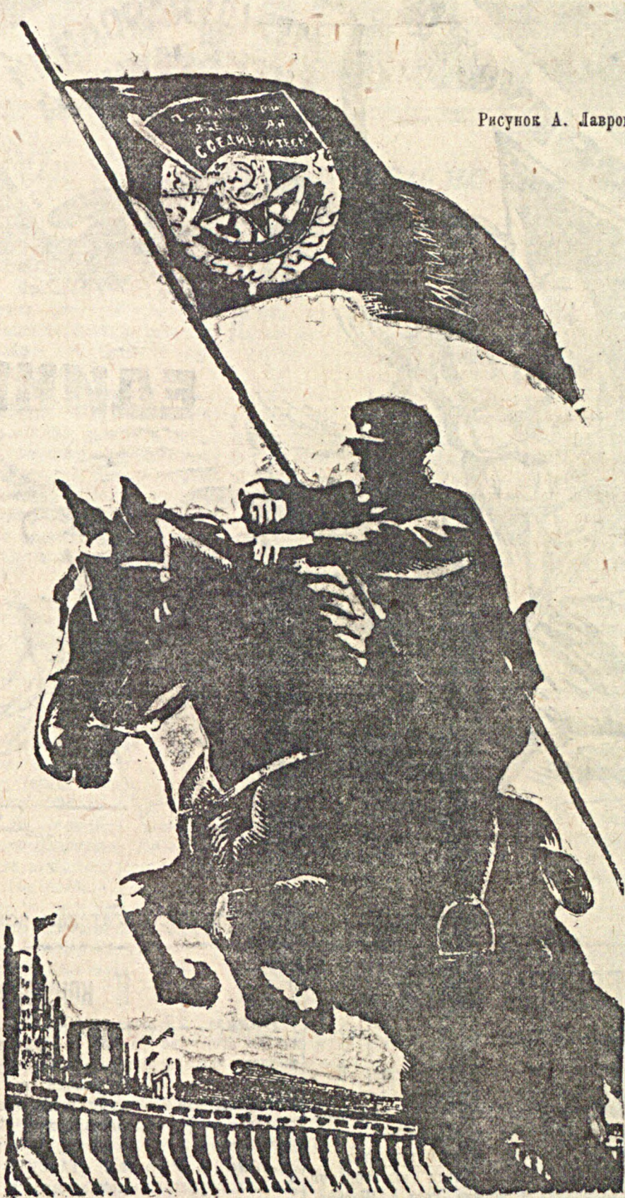
Рисунок А. Лаврова

Темпы строительства военно-морских кораблей в Японии значительно увеличились. Крейсеры, постройки которых требовалась 3—4 лет, строится в 2 года, миноносцы—в 18 месяцев, подводные лодки—в такой же срок.