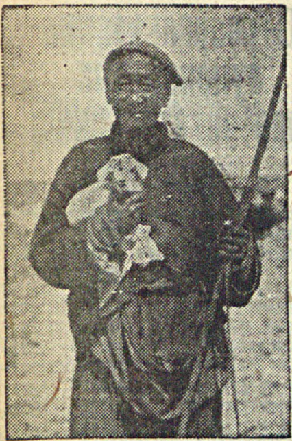
Юбилей 15-летия Монгольской Народной республики. На снимке: Монгольский араг (скотовод) со своим стадом в Убоби (Южная часть МНР)