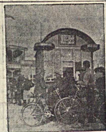
г. Энгельс. У ларька бродильника