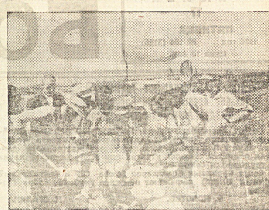
Учебный год в вузах окончен. Студенты приступили к практическим занятиям. На снимке: студенты Новочеркасского аграрного института на практических занятиях по изучению полезных растений.

Работа в международном социалистическом бюро являлась для тов. Дитвинова первой практической школой дипломатии, ибо здесь ему приходилось на всех ва-