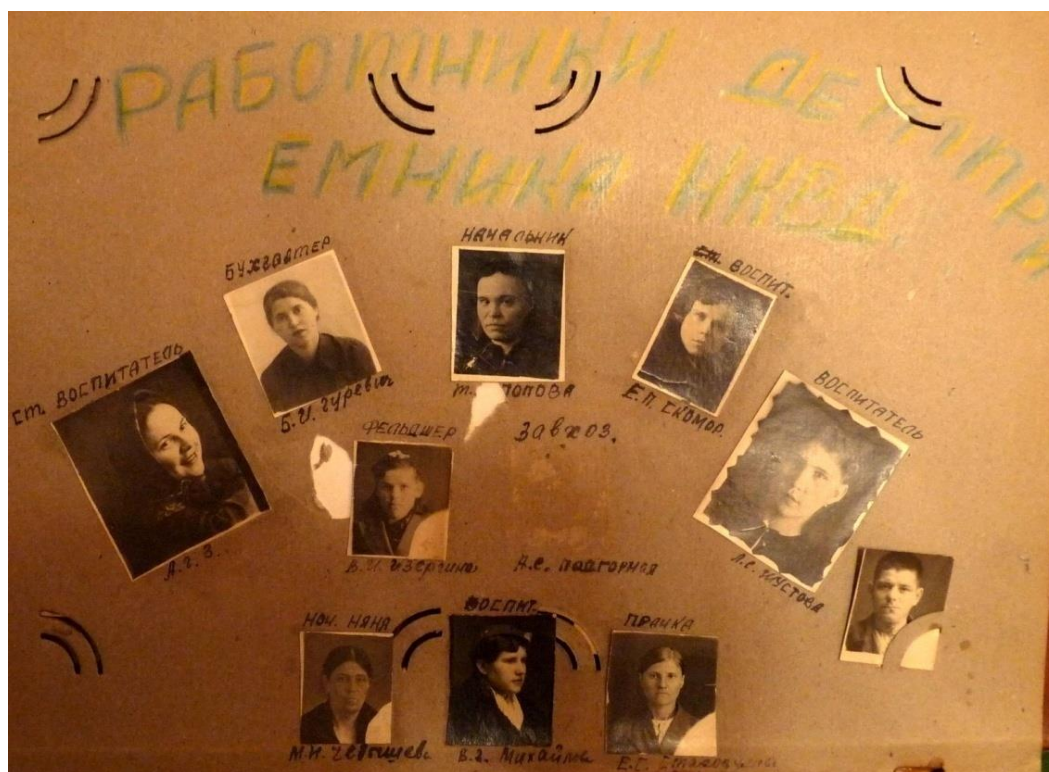
Фотография страницы из старого семейного альбома. Видна с трудом читаемая надпись «Работники детприёмника НКВД».