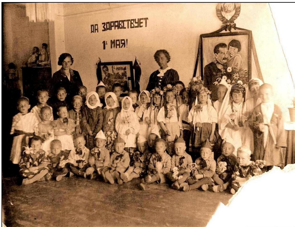
Первомайский утренник в детском саду. Энгельс, май 1938 года.

Старая потрёпанная фотография, на обороте надпись «Энгельс, 1938 г.» Первомайский утренник в детском саду, дети в национальных костюмах. Я крайний справа в костюме кавказца, на мне черкесска с газырями, на поясе кинжал. Кинжал и газыри, конечно, деревянные, обёрнутые фольгой, а свой кавказский ремень дал мне поносить папа.