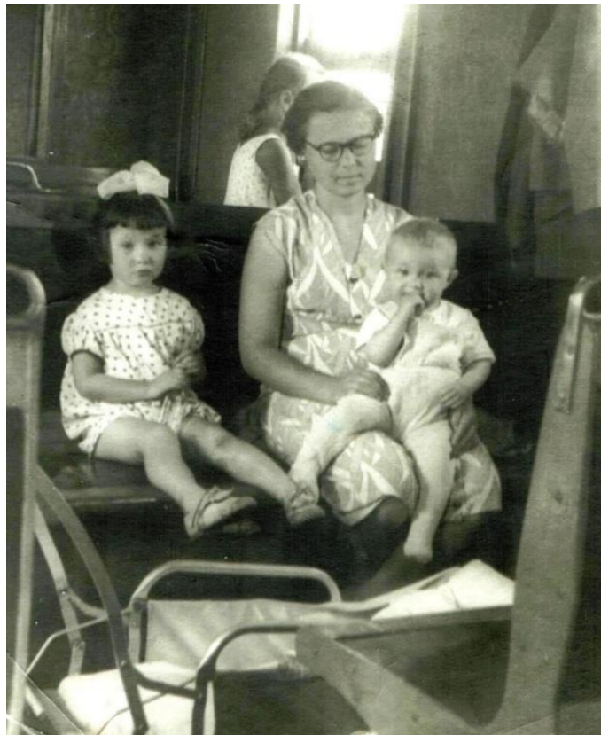
Моя семья в пригородном поезде «Темиртау-Караганда», 1959 год.

На этой фотографии обычная сцена – уставшая за воскресный день мама с детьми возвращается из гостей домой. Но эта сцена 1959 года была не совсем обычной.