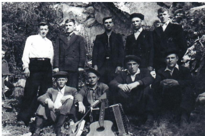
Беккер женились на репрессированных девчатах

Реку переполняла мутная вода, грозившая выйти из берегов. С шумом неслись последние льдины. На берегу Вишеры громоздились штабеля леса, заготовленные поселенцами. Скоро начнётся сплав леса по реке. Ему предстоит долгая дорога.