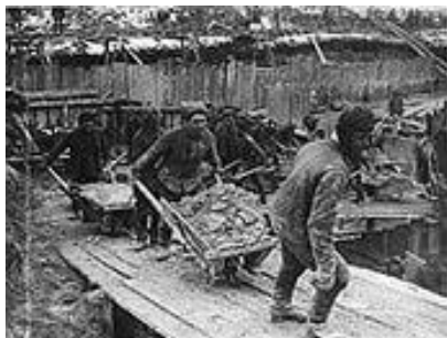
Трудармейцы.