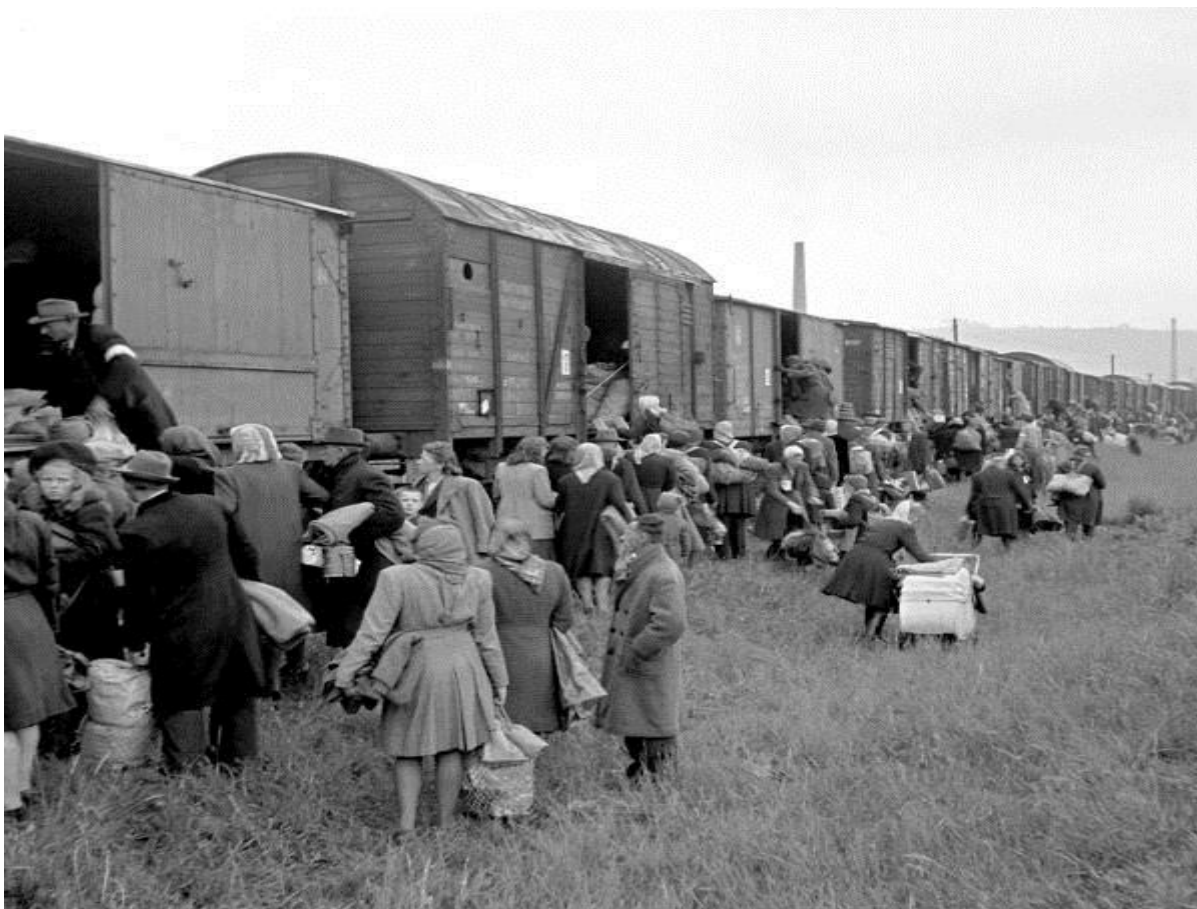
Депортация немцев на Восток.

крики, плач и ругань не прекращались весь день в ожидании поезда. Его не было и ночью, не было и утром и не было весь следующий день. Люди вымотались от суеты, жажды и неустроенности. Самой страшной бедой была безысходность их положения. Их, как скот, ведущий на убой, согнали на маленький привокзальный перрон, окружили солдатами и томили двое суток.