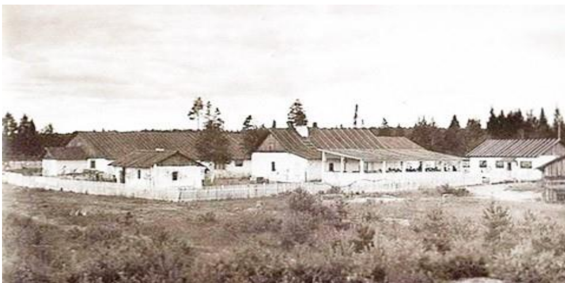
Лагерь под г. Ульяновском в совхозе имени «Сакко и Ванцетти».