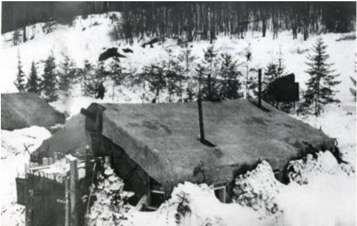
Бараки для немцев на Урале.