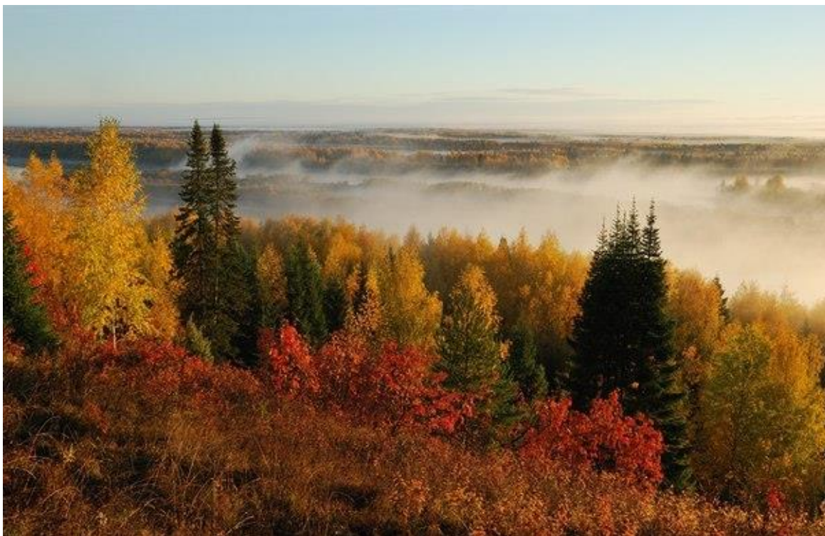
Осень на Урале.

расковывало обстановку и не требовало перевода. Никто не знал и не догадывался, что он бывший советский немец из Поволжья.