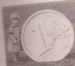
мечта о большой деньге...

В холодной воде мыться - здо- ровье укрепляет.