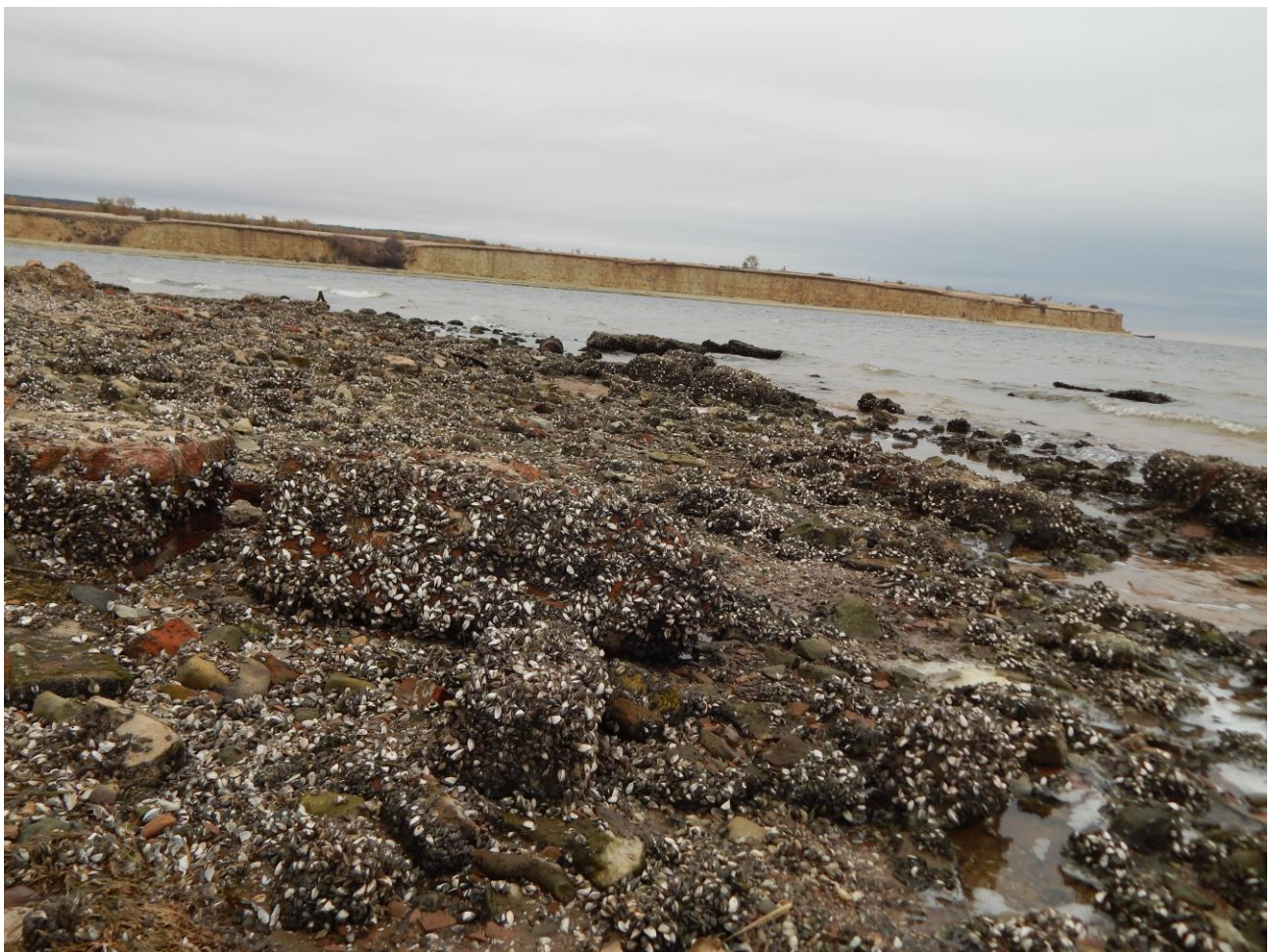
Остов от мельницы. Добринский залив при сбросе воды. Октябрь 2023 г.