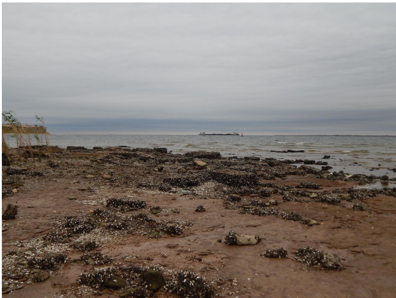
Сброс воды, осень 2023 г. Место, где стояла одна из паровых мельниц Н. Добринки.