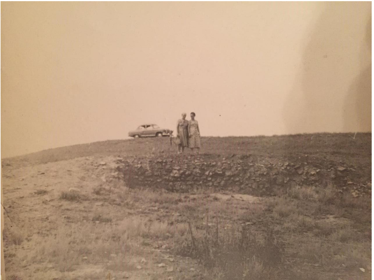
Потомки Гейнце (внучки) у развалин мельницы их предка. 1950-60-е гг. XX в.