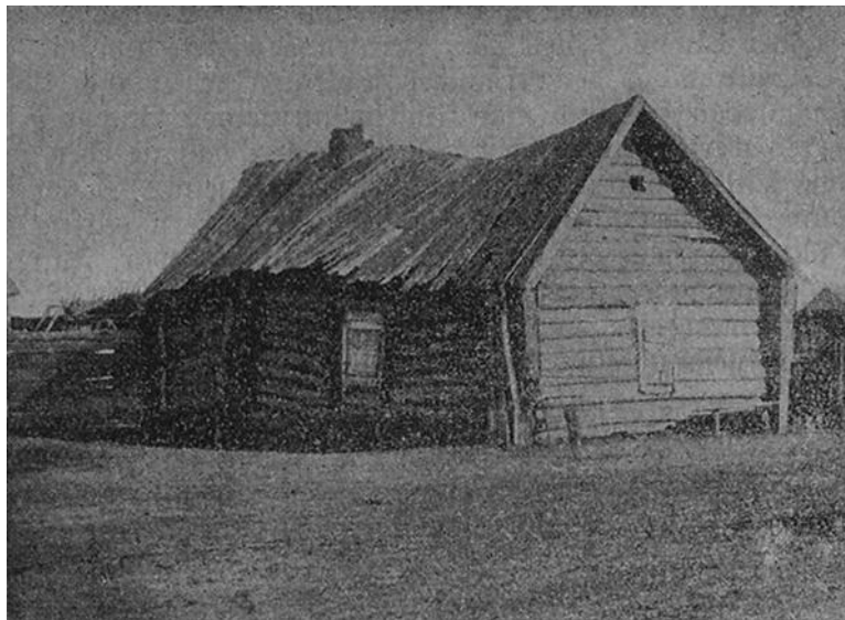
Коронный дом в с. Борегардт. Вид с теневой стороны. Фото 1908 г.

Коронный дом Пауля Обендорфера (Paul Obendörfer), принадлежавший в 1908 г. сыновьям Иоганна Готфрида Зиннера. Дом имел 3 сажени в длину и 3 сажени в ширину; окна – 1 аршин 5 вершков в высоту и 1 аршин 1 вершок в ширину. Сени являлись более поздней пристройкой.