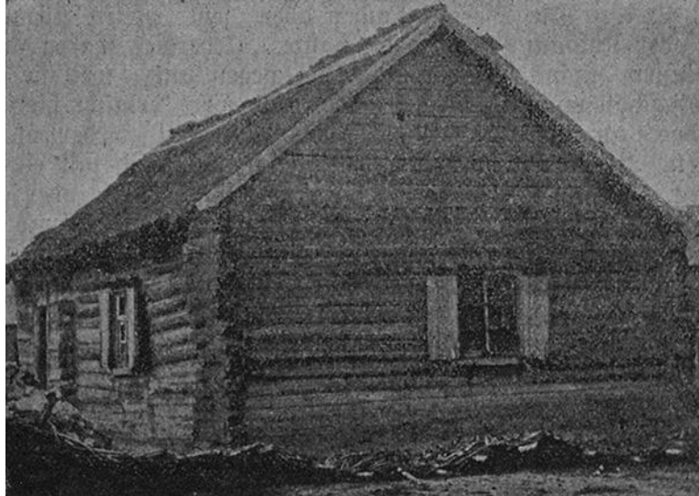
Коронный дом в Шталь-ам-Тарлык. Фото 1908 г.

При поселении колонистов построены им были от казны деревянные дома с соломенными крышами, а в колонии Розсопи, где поселились Французы из жженого кирпича. Ныне многие казенные дома уже перестроены, а те, кои остались неперестроенными, пришли в упадок по бедности хозяев.