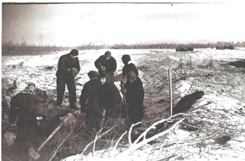
БАКАЛ МЕТАЛЛУРГИСТРОЙ . 1942.

Российские немцы – трудармейцы: на необжитом месте недалеко от города Челябинск, где зимой 1942 г. начали строить металлургический завод