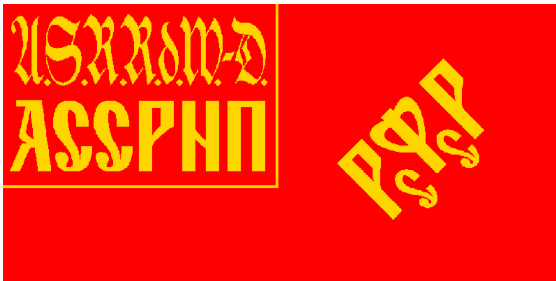
Рис. 5. Флаг АССР НП. Реконструкция.

Таким образом, мы с большой долей вероятности можем реконструировать государственный флаг АССР Немцев Поволжья 1926 года, который просуществовал до 1937 года (рис.5) (9)