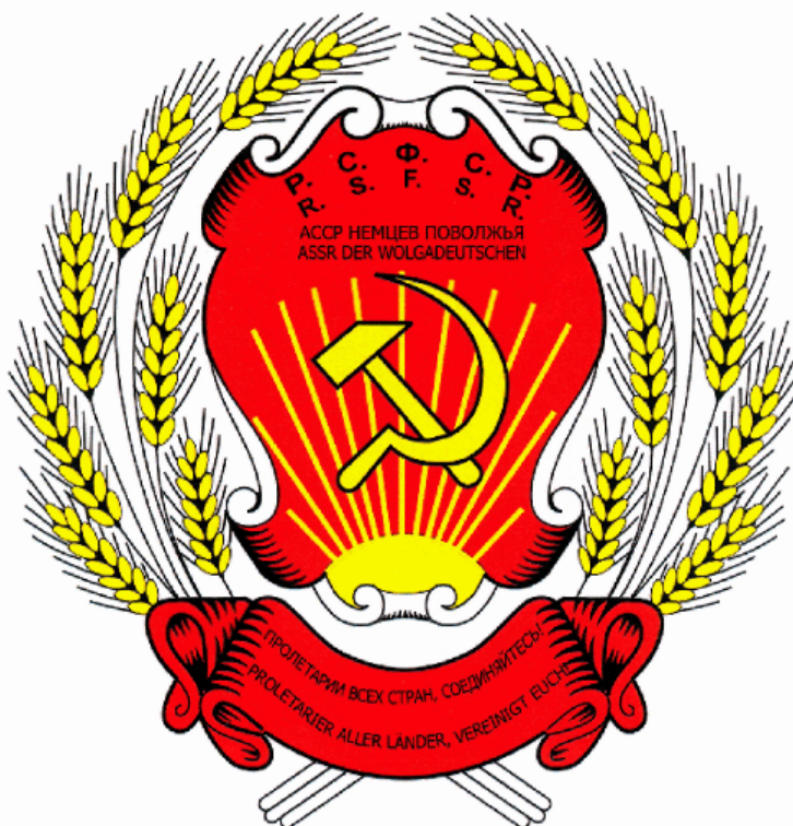
Рис. 7. Герб АССР НП. Рисунок Виктора Ломанцова.

Это постановление с изображением герба АССР НП было опубликовано 10.07.1937 на первой странице газеты «Большевик»(12) Точное цветное изображение герба создал на основе архивных документов Виктор Ломанцов (рис.7).