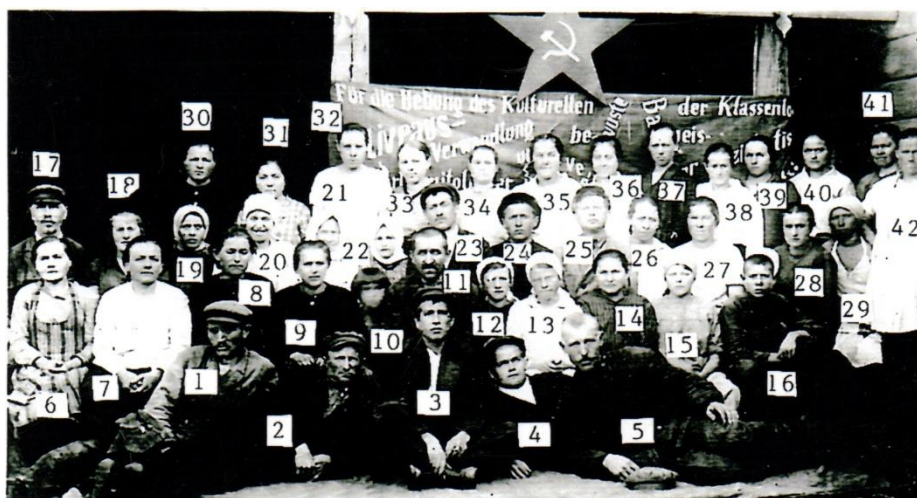
Фотография, вероятно, 1939 г. Рабочие артели «САРПИНКА».