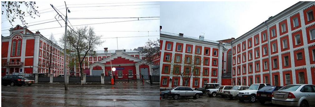
Самара. Бывшая городская тюрьма (ныне – медицинский институт)

На колени осталась отметина. Зарубка на память – теперь уж навсегда.