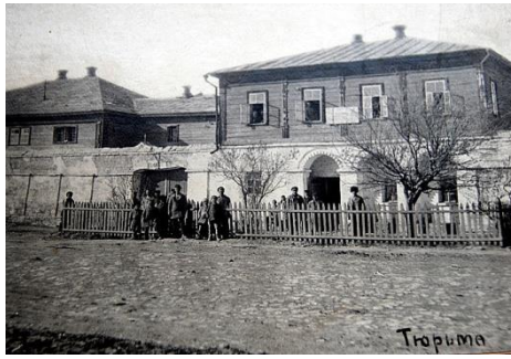
Пугачев, Дом принудительного труда